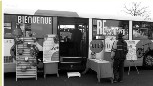
J'apprends à réparer et bricoler avec l'Utilobus !

Huit places disponibles pour chacun des ateliers. Gratuit sur inscription au 02 40 26 44 55.