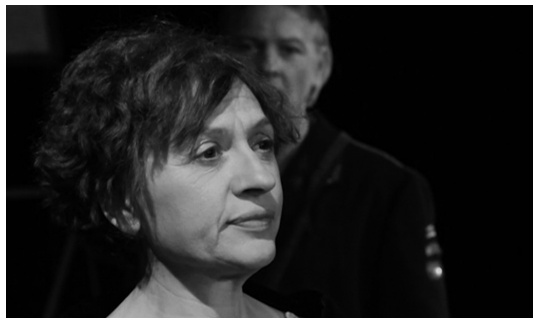
Spectacle «À l'arrière des tranchées» vendredi 9 novembre.

Plusieurs rendez-vous sont proposés à Saint-Aignan de Grand Lieu pour commémorer le centenaire de l'Armistice de la Grande Guerre.