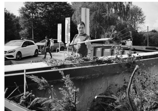
La déchetterie ferme pour deux semaines de travaux.

Commerçants dépositaires : UTILE, LA POSTE, HEL COIFF, MADEMOISELLE BULLE, LA BIGUENEE, L'ARBRE A PAIN, MAEVA COIFFURE, FLEUR DE GAÏA, CARROSSERIE RAIMBAUD, PIZZ' BURG, AGENCE IMMO, BOURMAUD PNEUS, PHARMACIE, RESTAURANT-CAFÉ DU LAC, SAINT-AIGNAN AUTOMOBILES, LES CELLIERS DE GRAND LIEU, BOUCHERIE, BAR-TABAC-PRESSE-LOTO-PMU DE L'ÉGLISE, CABINETS MEDICAUX ET PARAMEDICAUX, LAVERIE.