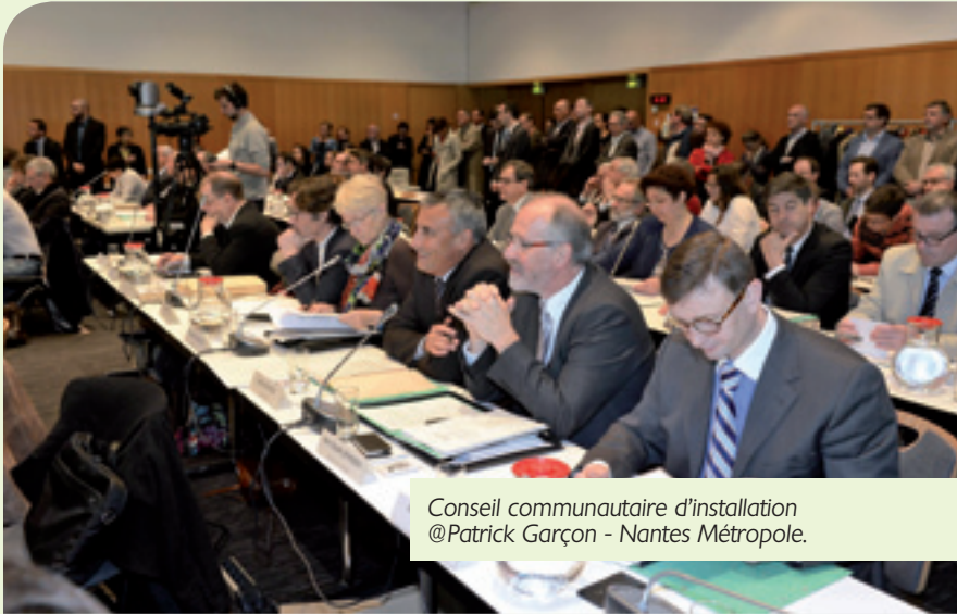
Conseil communautaire d'installation

Le mercredi 16 avril 2014, le conseil communautaire de Nantes Métropole a élu Johanna Rolland présidente et a adopté les grandes instances de gouvernance du mandat.