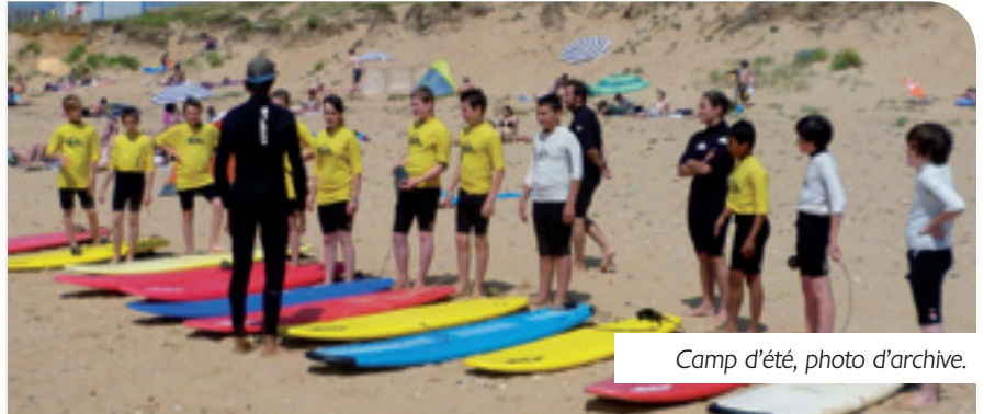
Camp d'été, photo d'archive.

Renseignements auprès du centre de loisirs. Tél. 02 40 31 09 42.