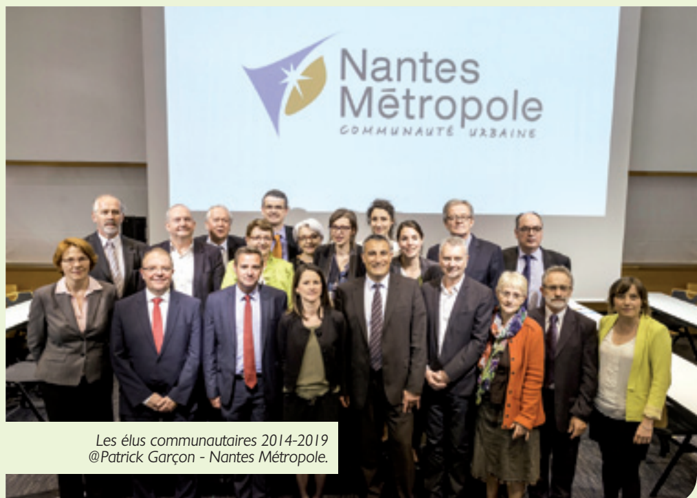
Les élus communautaires 2014-2019

Concernant les maires n'étant pas vice-présidents, d'autres délégations thématiques ont été attribuées (quatre), et neuf maires disposent d'une délégation territoriale.