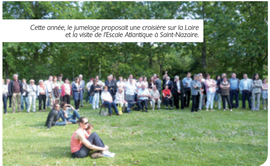
Cette année, le jumelage proposait une croisière sur la Loire et la visite de l'Escale Atlantique à Saint-Nazaire.

Dans le cadre des échanges entre les deux communes jumelées depuis 1995, Saint-Aignan de Grand Lieu recevait ses amis de Thüngersheim du 29 mai au 1 er juin 2014. Un soleil radieux a illuminé ce week-end de l'Ascension et 2014 apparaît déjà comme un excellent cru pour les rencontres franco-allemandes. Pendant ces quelques jours, la douce amitié qui unit les familles était perceptible. Les conversations s'en font encore l'écho. On songe déjà aux 20 ans du jumelage en 2015 et 2016, aux manifestations qui marqueront cet anniversaire, et aussi aux moyens d'amener de nouvelles générations à partager ces échanges.