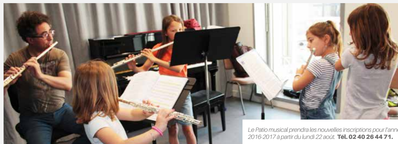
Le Patio musical prendra les nouvelles inscriptions pour l'année 2016-2017 à partir du lundi 22 août. Tél. 02 40 26 44 71.