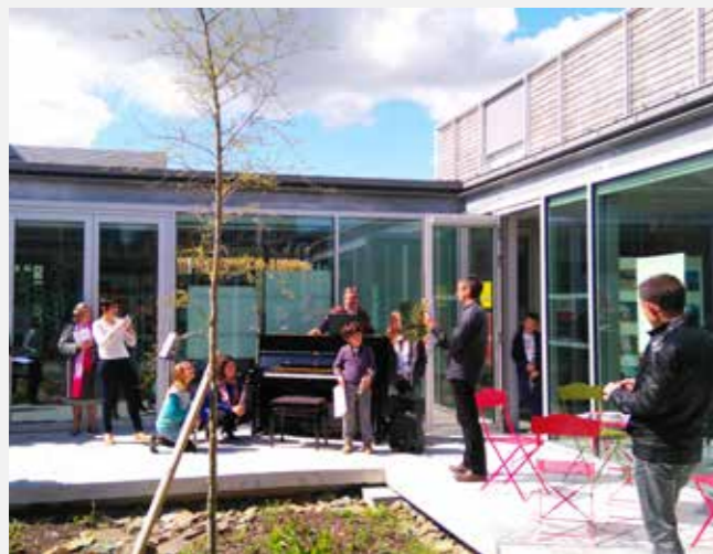
Mixture, c'est le nom d'une animation mélangeant musiques et textes qui s'est organisée à l'Espace Vie Locale en avril. Une première réussite coconstruite par le Jardin de Lecture, le Patio Musical et L'Espace Vie Locale.

Jouxtant deux autres bâtiments à vocation culturelle (Médiathèque et École de Musique), l'Espace Vie Locale est aussi le lieu de la complémentarité !