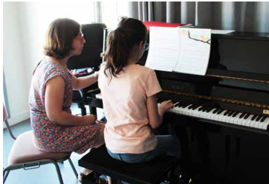
Lire aussi en page 13 le projet de l'École.

Le Conseil municipal du 23 mai a retenu à l'unanimité une tarification au taux d'équilibre pour les prestations de l'École de Musique.