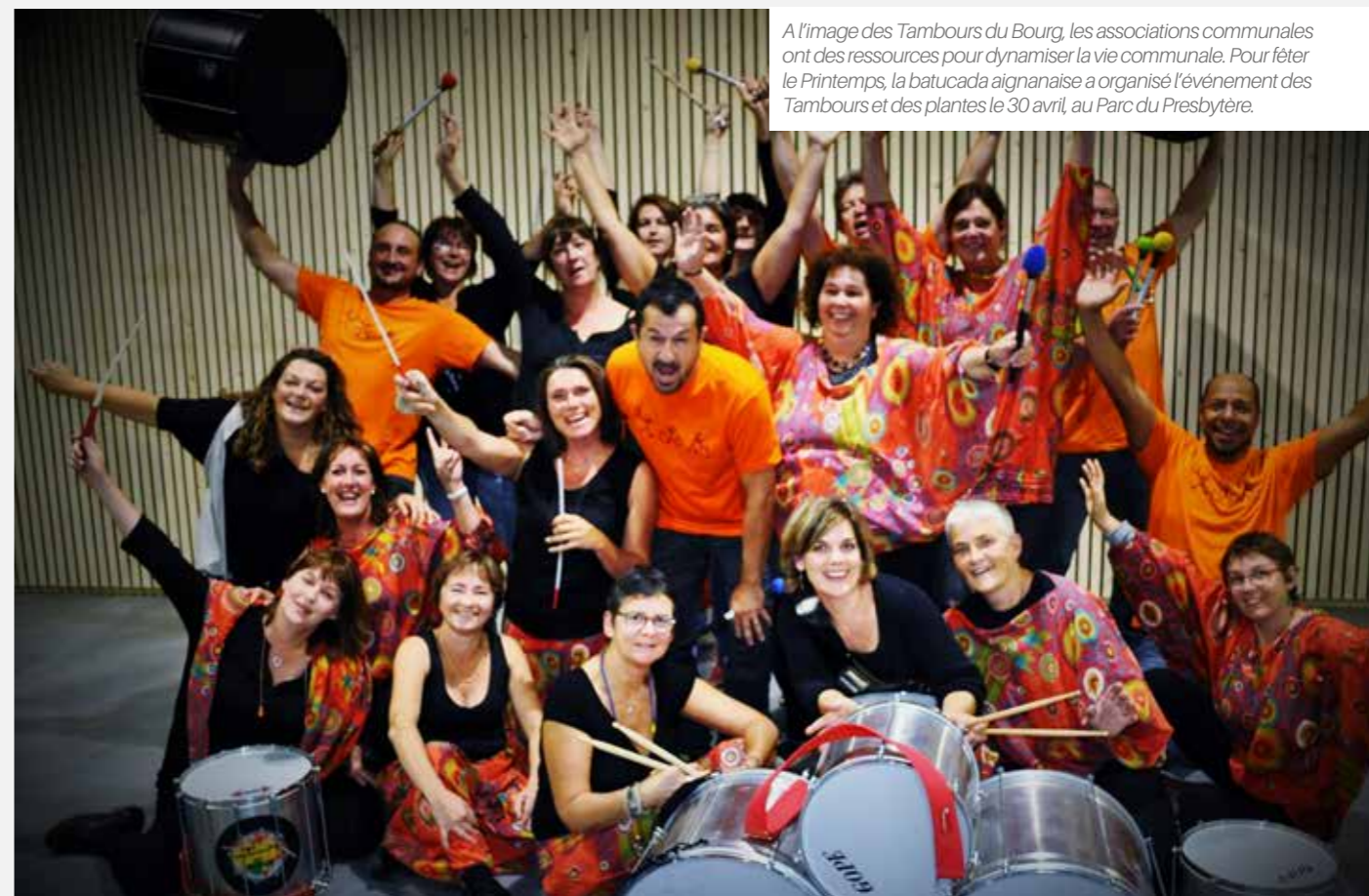
A l'image des Tambours du Bourg, les associations communales ont des ressources pour dynamiser la vie communale. Pour fêter le Printemps, la batucada aignanaise a organisé l'événement des Tambours et des plantes le 30 avril, au Parc du Presbytère.

La commune a inauguré en septembre dernier un nouvel équipement : l'Espace Vie Locale. Au cœur du bourg, ce pôle socio-culturel rassemble aujourd'hui les acteurs associatifs et sportifs avec pour objectif de fédérer les forces vives.