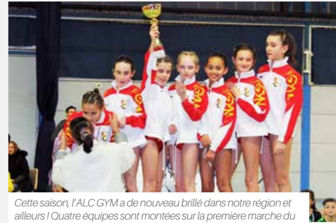
Cette saison, l'ALC GYM a de nouveau brillé dans notre région et ailleurs ! Quatre équipes sont montées sur la première marche du podium lors des compétitions départementales de Bouaye et de Doulon, dont les N8 Féminines ici en photo.

Le spectre de la vie locale aignanaise couvre beaucoup d'activités culturelles et sportives ; un Mag' entier ne suffirait pas à l'illustrer ! En attendant le supplément plus complet de la Vie Locale qui sera distribué avec le magazine de l'Automne, voici quelques clichés de nos associations en action.