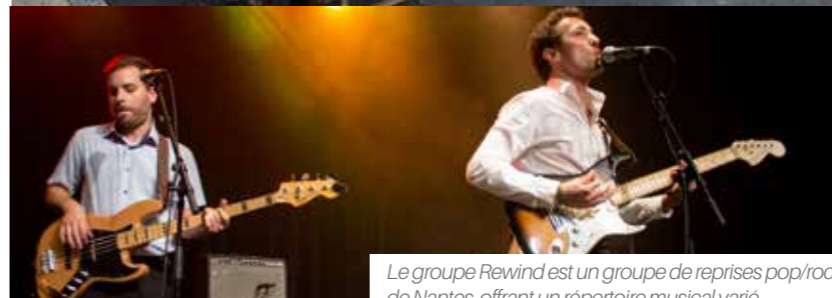
Le groupe Rewind est un groupe de reprises pop/rock de Nantes, offrant un répertoire musical varié.