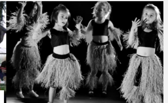
Salle de l'Héronnière, les 11 et 12 juin derniers. Les danseuses et danseurs de l'ALSA ont offert un spectacle très poétique invitant au voyage.