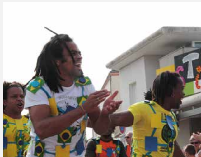
Comme d'autres, l'association Ginga Nos Capoeira avait participé aux Festifolies 2014.

Le Conseil de la Vie Locale s'est interrogé sur la participation des bénévoles du monde associatif. Dès à présent, la commune recherche des citoyens volontaires pour préparer la fête. Rejoignez les équipes du festival, renseignements à l'Espace Vie Locale. Tél. 02 40 26 44 71.