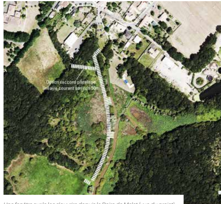
Une fenêtre sur le lac s'ouvrira depuis la Boire de Malet (vue du projet)

Coût de l'aménagement : environ 170 000 €, cofinancés par le département.