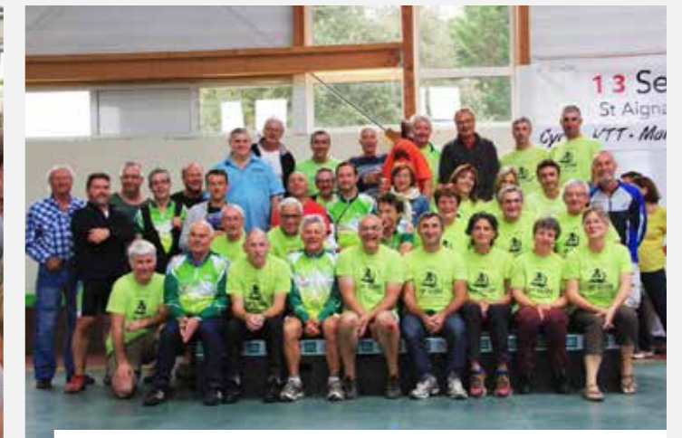
Lors de la randonnée 2015 « La Grand Lieu », les bénévoles du Cyclo Club de Grand Lieu prennent la pose. La prochaine édition aura lieu le dimanche 11 septembre prochain. Notez la date.