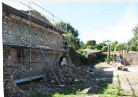
PLANCHE MIRAUD LE PETIT PATRIMOINE SE RESTAURE

Après l'ouverture de la parcelle et son défrichage, les travaux de réhabilitation d'une ancienne cave jouxtant le château de la Plinguetière ont débuté en juin.