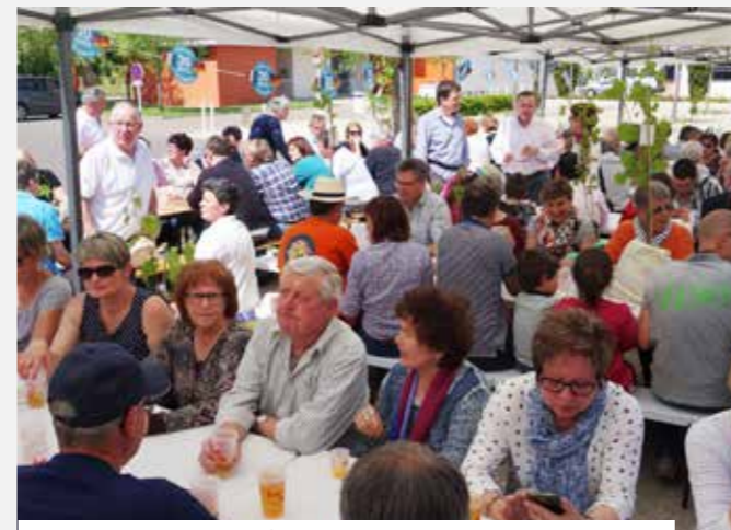
Début mai, le jumelage a fêté ses 20 ans : exposition, visite de la Maison du Lac, apéro-concert... la fête a été une réussite comme ici lors de l'accueil des Allemands au square Thungersheim.