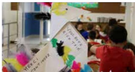
Une cocotte en papier fabriquée par les enfants de l'accueil périscolaire siégeait au restaurant scolaire le 21 novembre : le message, clair, est passé. Une distribution de "cocottes du tri" avaient été remises aux plus jeunes, avec des bonbons, en partenariat avec API restauration.