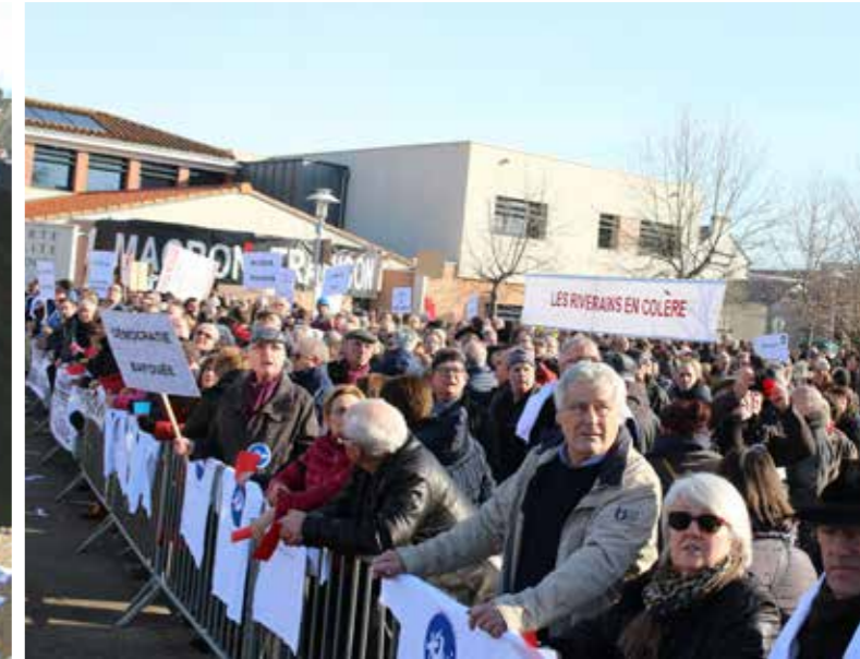
Manifestation des riverains

ne serait plus qu'à 700 m ! Impensable ! Par ailleurs, 90% de notre territoire est couvert par un Plan d'exposition au bruit (PEB) qui comprend quatre zones de A à D, du plus contraignant au moins contraignant. Aujourd'hui, le centre-bourg se situe en zone C. Avec ce projet, il passerait en zone B. En zone C, il est interdit de construire de nouveaux logements pour ne pas exposer davantage de personnes au bruit et aux nuisances. En zone B, seuls les équipements aéroportuaires sont autorisés. Sans possibilité de construire ou de réhabiliter le centre-bourg, comment maintenir sa vitalité quand par ailleurs la loi Littoral - qui vise à préserver l'environnement - nous contraint fortement dans notre développement sur le reste du territoire du fait de notre proximité avec le lac ?