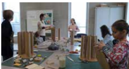
Les enfants se sont initiés à la fabrication de meubles en carton à l'EVL : quoi de mieux pour apprendre à recycler que de donner une seconde vie aux emballages ?

Du 18 au 22 novembre, des ateliers et animations enfants et adultes proposés en partenariat avec Nantes Métropole avaient cours dans la commune, dans le cadre de la semaine européenne de la réduction des déchets. Retour en images sur les ateliers jeune public.