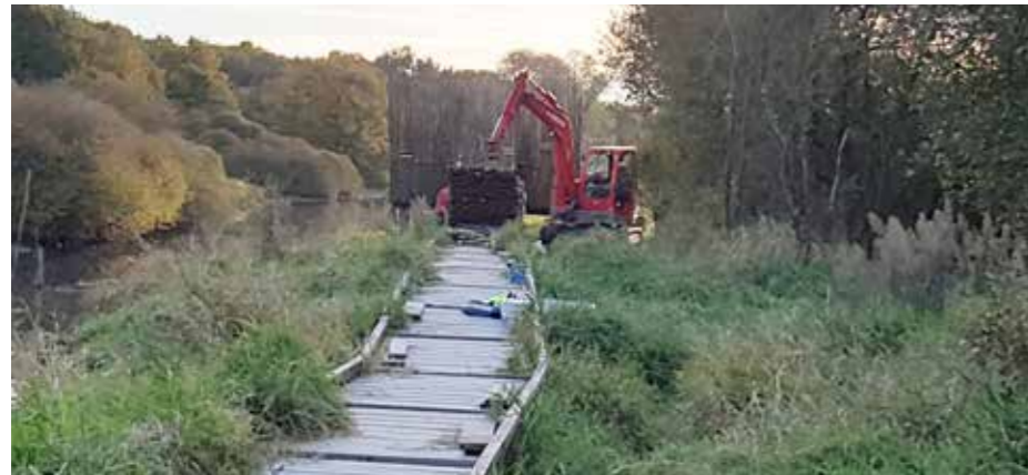
La commune a procédé au démontage de la passerelle en bois conformément à l'injonction reçue du ministère. Elle est stockée en attendant de savoir comment elle pourra être réutilisée, à l'identique ou pour un autre projet selon la décision du juge attendue mi-2018.

Suite à l'information insérée dans le Mag d'automne, avisant les Aignonais(es) de l'injonction du Ministre de la Transition écologique et solidaire de démonter le cheminement en bois longeant le ruisseau des Epinais, qui autorisait un regard sur la Boire de Malet, nombreux sont les lecteurs(trices) qui ont fait part de leur indignation ou de leur soutien à la municipalité et plus encore, de leur incompréhension. Une motion, invitant à une démarche de compromis qui permette de mieux concilier les nécessités de préservation d'un environnement classé Natura 2000 et la volonté de la commune de renouveler son