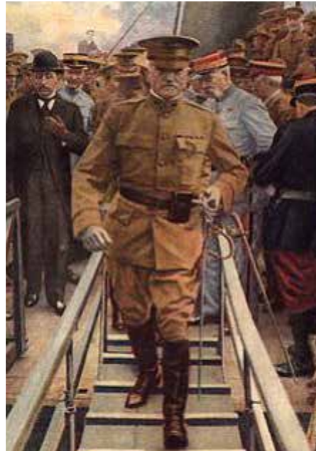
Tableau représentant le Général John Pershing lors de son arrivée à Boulogne-sur-Mer.

de février provoque en quelques jours l'abdication de l'empereur Nicolas II, la fin de l'Empire russe et de la dynastie des Romanov. Elle se déroula entre le 23 février 1917 et le 3 mars 1917.