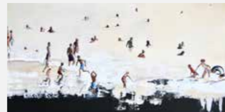
"Sans titre I", de Marianne Alliot.

Chaque année, la commune fait l'acquisition d'une oeuvre du salon au titre du dispositif "1 % artistique". Cette année, c'est une oeuvre de Marianne Alliot qui a été choisie, intitulée "Sans titre I".