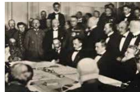
Signature du traité de paix séparée de Brest-Litovsk (mars 1918).

Le 25 octobre 1917, les bolcheviques lancent leurs partisans dans un soulèvement armé à Petrograd contre le gouvernement provisoire et liquide ainsi le pouvoir bourgeois en quelques heures.