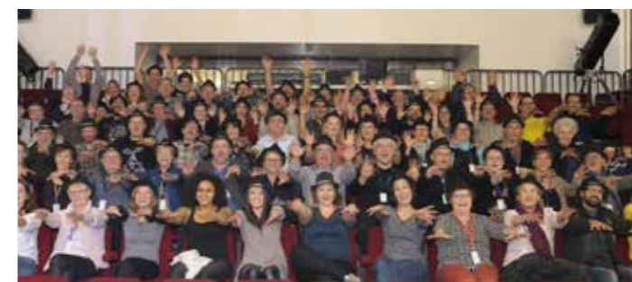
La troupe et l'équipe de bénévoles du Téléthon Live 2017.

Lors de la dernière bourse, deux foulards, une pièce d'avion et une pièce de puzzle ont été oubliés. Pour toute réclamation, s'adresser en mairie.