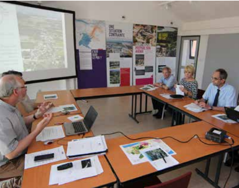
Rencontre avec les trois médiateurs