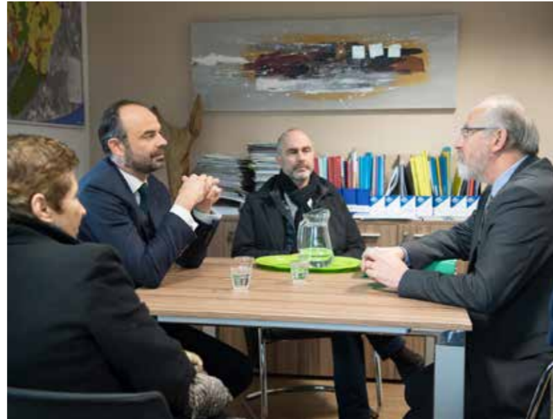
Entretien avec Edouard Philippe, Premier ministre