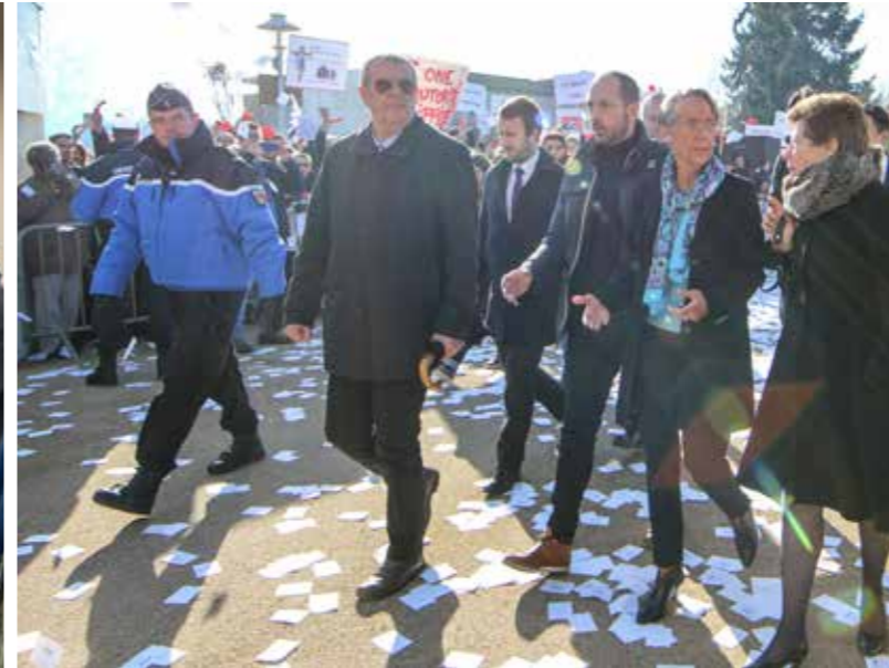
Visite d'Elisabeth Borne, ministre des Transports