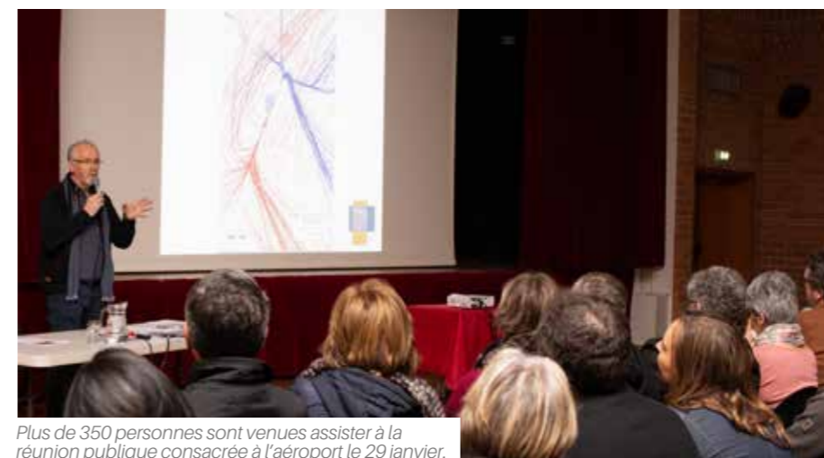
Plus de 350 personnes sont venues assister à la réunion publique consacrée à l'aéroport le 29 janvier.

À l'unanimité, le conseil municipal a rendu un avis défavorable sur le PGS. Les élus du Sud Loire défendent ensemble 7 résolutions pour protéger leur territoire. Tous les maires de Nantes Métropole s'accordent pour interdire les vols de nuit.