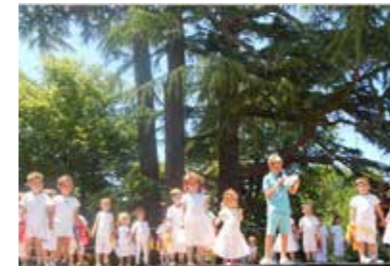
La kermesse - été 2017

L'A.P.E.L. (Association de Parents d'élèves de l'Enseignement Libre) accompagne l'avenir de nos enfants.