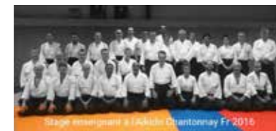
Bifa Chantonay octobre 2016