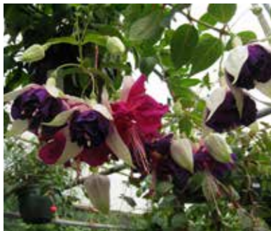
Sortie visite le 30 mai 2017