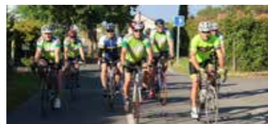
Journée découverte 31 mai 2017

Des sorties exceptionnelles avec liaison vélo comme Saint-Aignan de Grand Lieu/Thüngersheim ou Saint-Aignan de Grand Lieu/Agen ont également lieu.