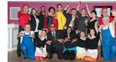
La troupe du Téléthon Live

L'équipe du Téléthon Live remercie les bénévoles, les sponsors et les participants à la manifestation 2016 qui proposait un spectacle musical original : « Hôtel Le Renouveau ». Cet événement a permis de remettre la somme de 15 622,80 € à l'AFM (Association Française contre les Myopathies) et de présenter notre production devant un public toujours plus nombreux (près de 800 spectateurs). C'est le fruit du travail d'une grande et belle équipe (chanteurs, danseurs, comédiens, musiciens, décorateurs, costumiers, cuisiniers, techniciens...).