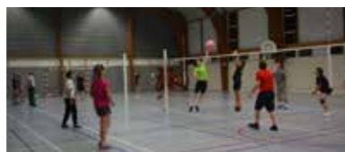
Les participants au grand tournoi de soft du 30 juin 2017