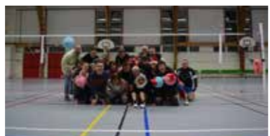
Le tournoi interne de Noël 2016

Le club de Volley de Saint-Aignan de Grand Lieu rouvre ses portes pour une deuxième saison avec toujours deux propositions d'activités tous les jeudis soirs à la salle Omnisport : Le soft volley mixte - de 19h à 20h30 Le Volley Ball loisir mixte - de 20h30 à 22h30.