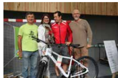
La gagnante du VTT - 1 er lot de la tombola à l'issue de la rando

Chaque année, le 2 e dimanche de septembre, nous organisons notre grande randonnée. Le 10 septembre 2017 avait lieu la 13 e randonnée, où 688 participants ont pu découvrir les routes et chemins de notre commune et des communes voisines. Quatre activités ont été proposées : la marche, le VTT, le cyclo de route et la course nature.