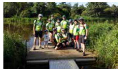
Le Tour du Lac 73 kms par les chemins - le 11 juin 2017

Chaque année, le 2 e dimanche de septembre, nous organisons notre grande randonnée. Le 10 septembre 2017 avait lieu la 13 e randonnée, où 688 participants ont pu découvrir les routes et chemins de notre commune et des communes voisines. Quatre activités ont été proposées : la marche, le VTT, le cyclo de route et la course nature.