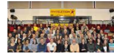
L'équipe de bénévoles 2016