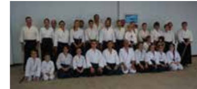
Stage Arme Hendaye 2017

L'aïkido est une discipline martiale créée dans les années 30 au Japon par Maître Morihei UESHIBA. Il fut inspiré par les meilleurs maîtres d'arts martiaux de l'époque.