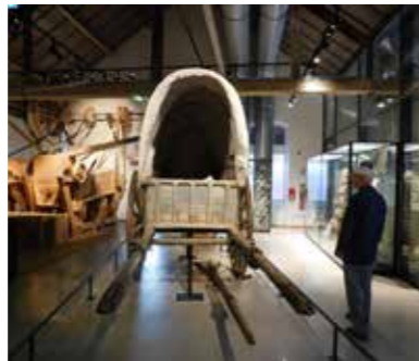
Le club organisait une sortie surprise le 29 juin

Contact pour tous renseignements Tél. 1 : 02 40 31 07 10 Tél. 2 02 40 31 03 45