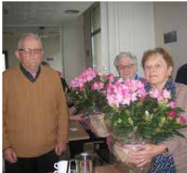
Journée marquée par des anniversaires le 27 avril

Le 15 avril : fête de la coquille à Erquy (Côtes d'Armor) - Dix-sept participants étaient présents à ce grand rassemblement festif en l'honneur de la coquille Saint-Jacques.