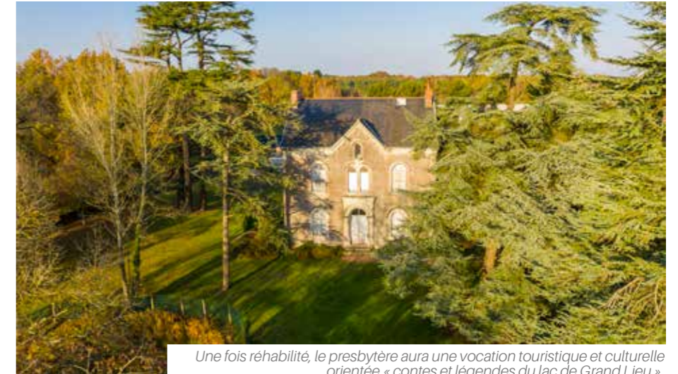
Une fois réhabilité, le presbytère aura une vocation touristique et culturelle orientée « contes et légendes du lac de Grand Lieu ».

Le presbytère présente un réel intérêt patrimonial tant pour son architecture que pour son parc*. Aussi, l'ensemble du site va être réhabilité. Il constituera une nouvelle porte d'entrée sur le lac de Grand Lieu dédié aux contes et légendes qui l'entourent.