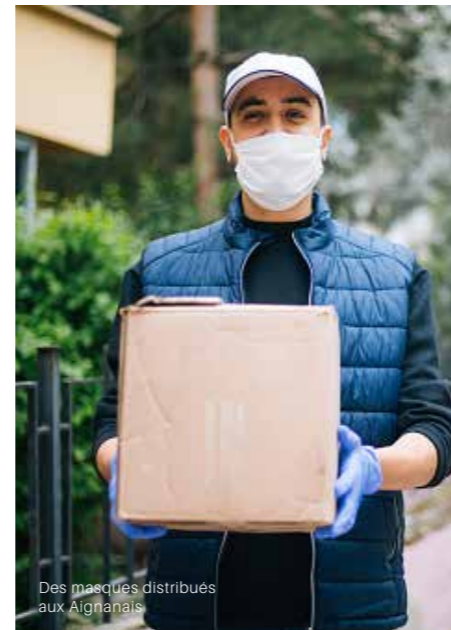
Des masques distribués aux Aignonais

Le conseil municipal du 4 mai 2020 a décidé de distribuer gratuitement un masque par adulte et enfant à partir du collège. La commune a pour cela passé une commande de masques en tissus grand public et s'est associée à Nantes Métropole pour des exemplaires complémentaires. Les personnes de plus de 75 ans et leur conjoint ont reçu leur masque chez elles, grâce à la protection civile.